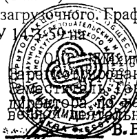
Таблица 2. Колонка «Патрубок люка загрузочного. Графа - Технические требования». Заменить ссылку ТУ 14-3-1905.