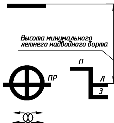
Рис. 3.1.4-2. Грузовая марка судов с минимальным надводным бортом