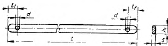
l — длина; l_1 — расстояние от конца прутка до центра отверстия; h_2 — высота; s — толщина; d — диаметр отверстия