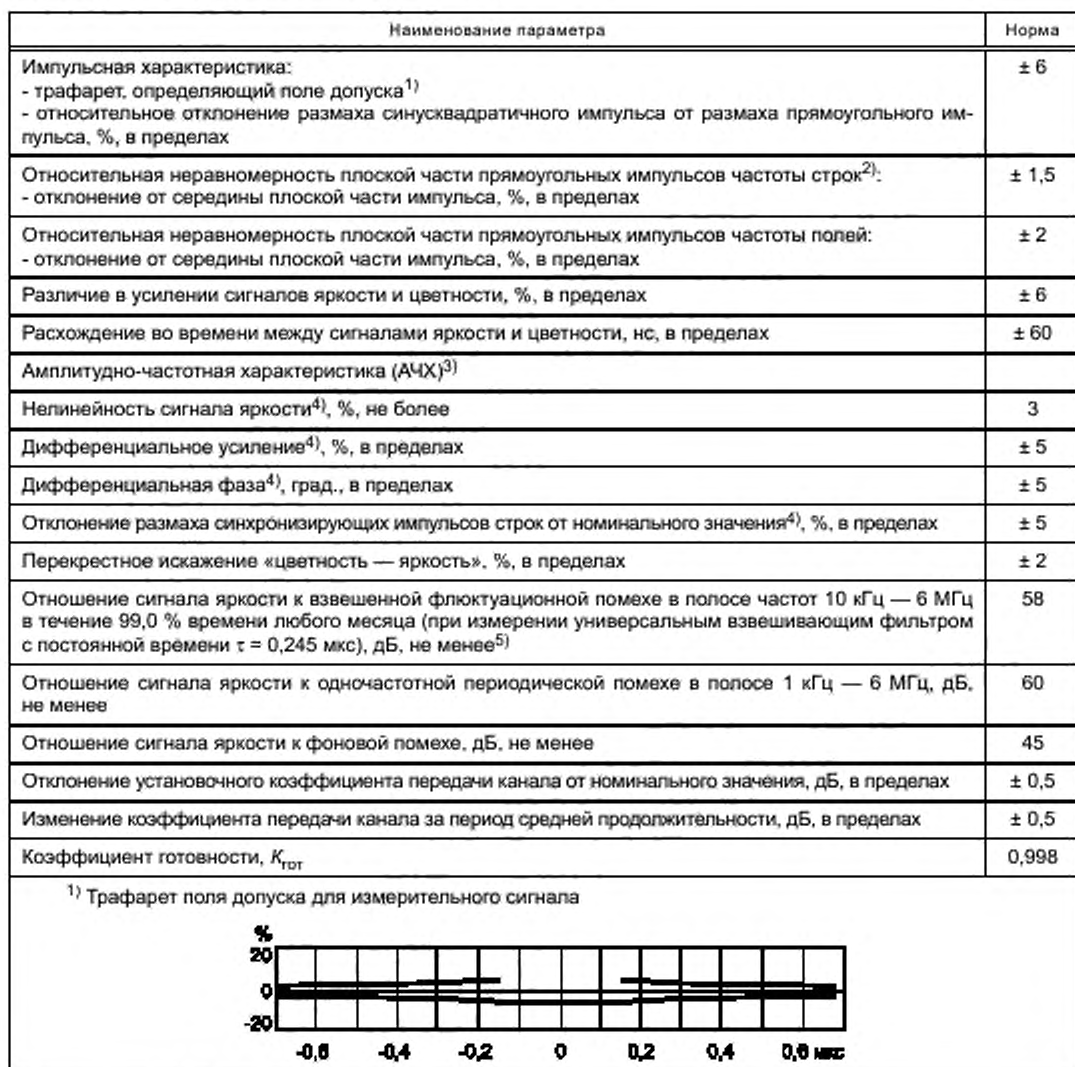
Таблица 3 — Нормы на основные параметры ЭВКИ

Нормы на основные параметры ЭВКИ приведены в таблице 3.