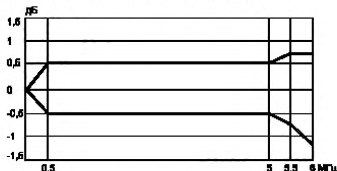
Координаты точек перегиба линий трафарета

3) Трафарет, определяющий поле допуска на неравномерность АЧХ