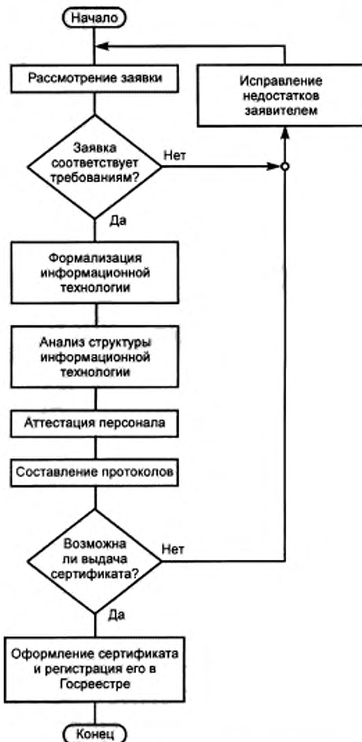
Рисунок А.2 — Блок-схема алгоритма процедуры аттестации информационной технологии в области качества служебной информации

При аттестации персонала, обеспечивающего качество служебной информации, могут использоваться специальные тесты. Компьютерные методики оценки свойств человека облегчают контроль и обеспечивают объективность.