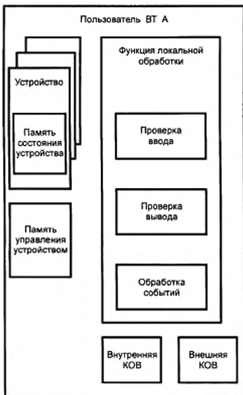
Рисунок 3 — Структура терминального пользователя ВТ

Во время обработки данных от своих устройств обновления объекта пользователь ВТ может идентифицировать события, которые имеют значение в семантике объектов, присутствующих в КОВ. Примерами являются события ввода в поле и события завершения, которые определены в 3.3.65 и 3.3.72 ГОСТ Р ИСО 9040 соответственно. Эти события вызывают действия, определенные семантикой этих объектов. Результатом этих действий может быть обновление объекта или «доставка»