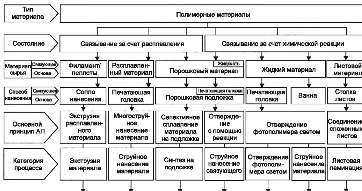
Рисунок В.3 — Обзор одношаговых аддитивных технологических процессов для полимерных материалов