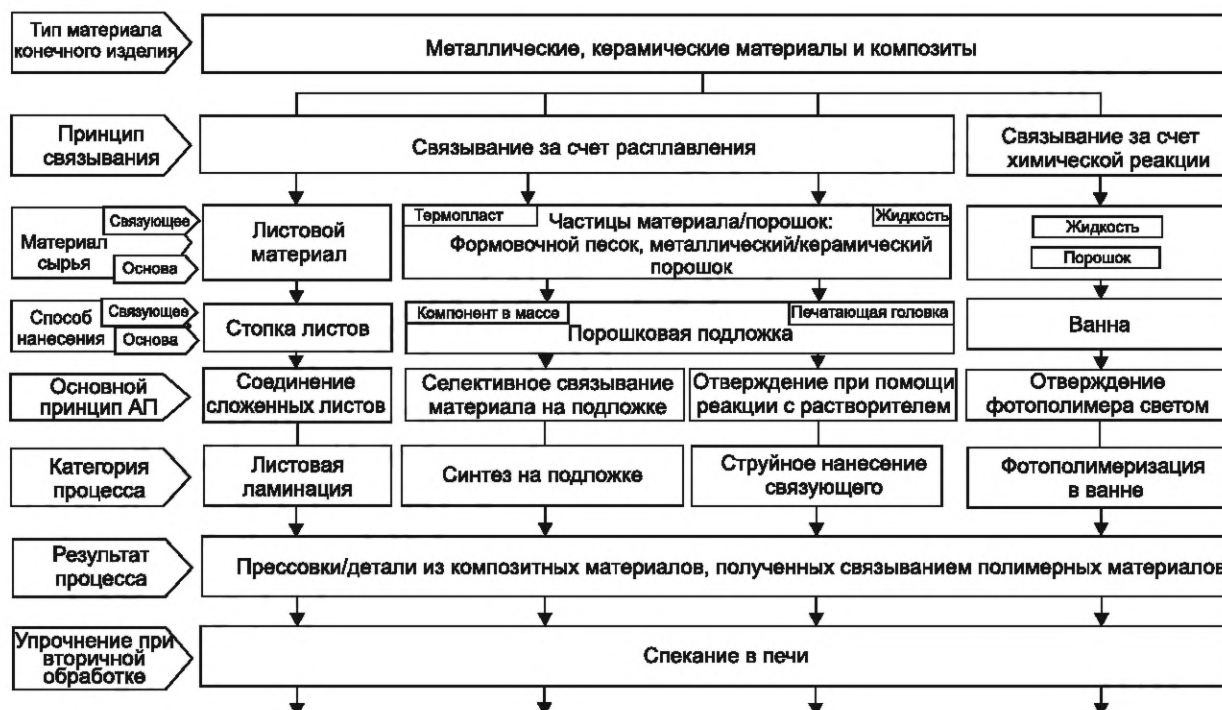
Рисунок В.5 — Описание многошаговых аддитивных технологических процессов для металлических, керамических и композитных материалов