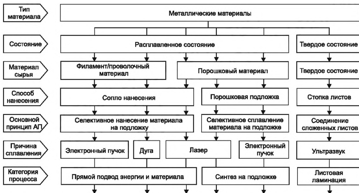
Рисунок В.2 — Обзор одношаговых аддитивных технологических процессов для металлических материалов

Благодаря широким возможностям для варьирования различных видов материалов, видов сырья и способов его нанесения существует большое количество возможных принципов, которые могут быть использованы для аддитивных технологических процессов. Однако несмотря на то, что во всем мире проводят значительное количество исследований и опытно-конструкторских работ в данной области, далеко не все потенциальные решения были реализованы, и еще меньшее их количество представлено на рынке. На рисунках В.2—В.5 приведен обзор технологических принципов, которые в настоящее время доступны на рынке и доказали свою жизнеспособность в промышленности.