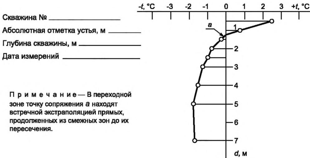
Рисунок Г.1 — Пример графика распределения температуры t, ^\circ\text{C} , грунта в скважине глубиной d для одноразовых измерений температуры