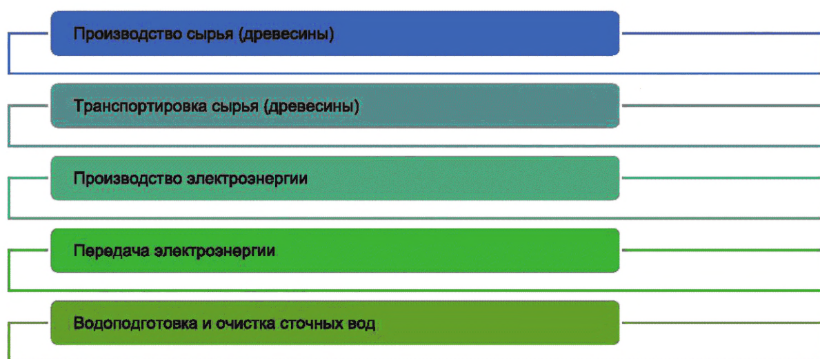
Рисунок 4 — Вспомогательные процессы в целлюлозно-бумажной промышленности

Вспомогательные процессы в целлюлозно-бумажной промышленности представлены на рисунке 4.