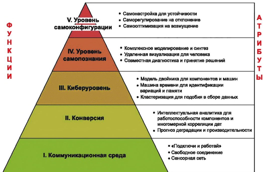
Рисунок 2 — 5-уровневая архитектура КФС