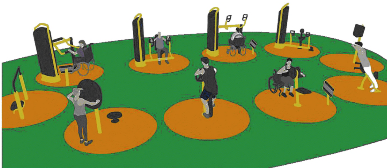
Рисунок А.1 — Пример визуального выделения зоны безопасности оборудования

А.1 Пример визуального выделения зон безопасности оборудования показан на рисунке А.1.