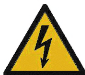
Рисунок 1 — Обозначение электрических компонентов напряжения класса В

Если в настоящем стандарте не указано иное, то БАБС должна соответствовать требованиям электробезопасности по ИСО 13063-3. Требования по электробезопасности должны выполняться на уровне компонентов или на уровне ТС. Знак ИСО 7010—W012, приведенный на рисунке 1, должен быть виден на БАБС, которая является частью электрических цепей напряжения класса В.