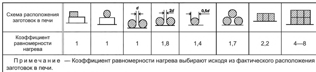
Т а б л и ц а Б.2 — Коэффициенты равномерности нагрева

Если садка печи состоит из нескольких заготовок с различным положением на поду (или в рабочем пространстве вертикальной печи), то полученный при расчете результат нужно умножить на коэффициент равномерности нагрева в соответствии с приведенными в таблице Б.2.