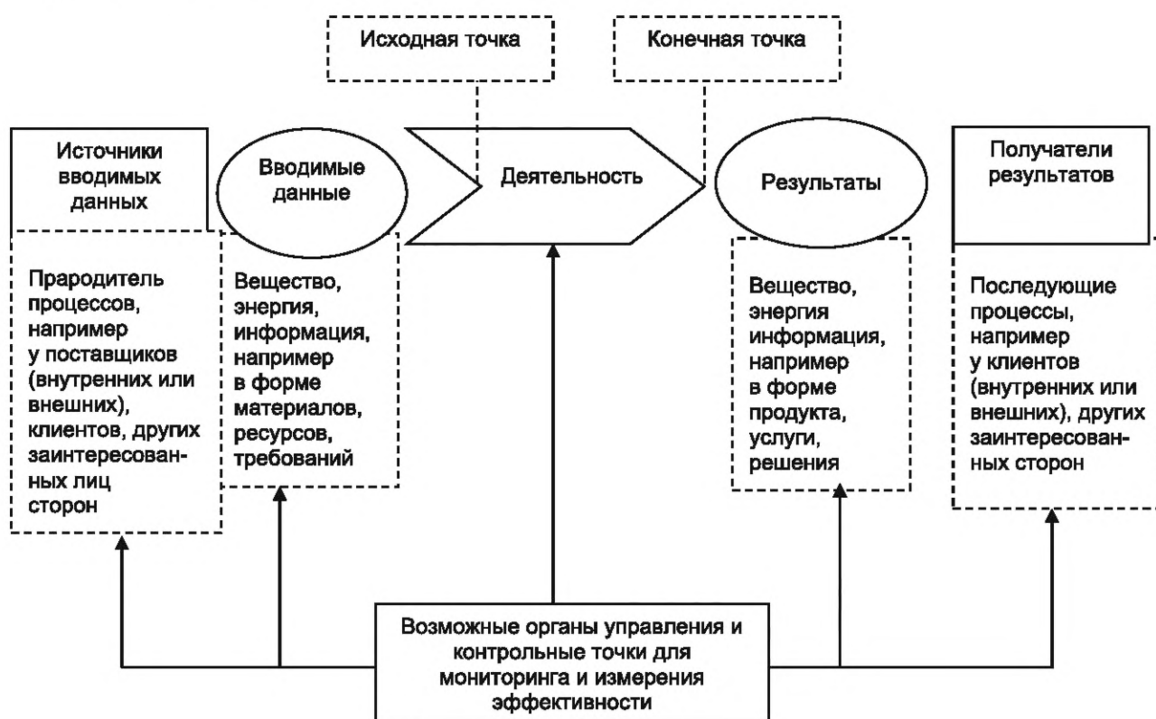
Рисунок 2 — Схематическое представление элементов одного процесса

4.2.1 Общие положения разработки и применение схемы сертификации процессов изложены в ИСО/МЭК 17067:2013, раздел 6. В настоящем стандарте приведена информация о том, как эти общие положения реализуются в определенной схеме сертификации процессов. На рисунке 2 схематично представлены элементы одного процесса.