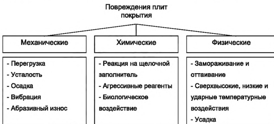
Рисунок 1 — Классификация причин повреждения бетона

Причины повреждения бетона по ГОСТ 32016 классифицируют согласно рисунку 1.