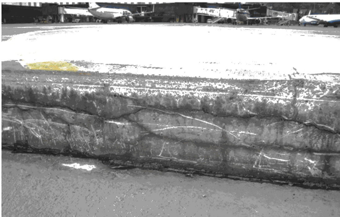
Рисунок 2 — Внутренние трещины, превратившие монолитную плиту в слоистую систему

Пример потери продольной устойчивости плит приведен на рисунке 3.