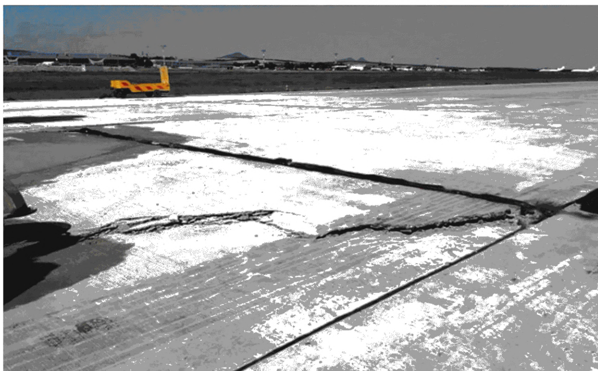
Рисунок 3 — Откол угла плиты в результате температурного перенапряжения

Пример потери продольной устойчивости плит приведен на рисунке 3.