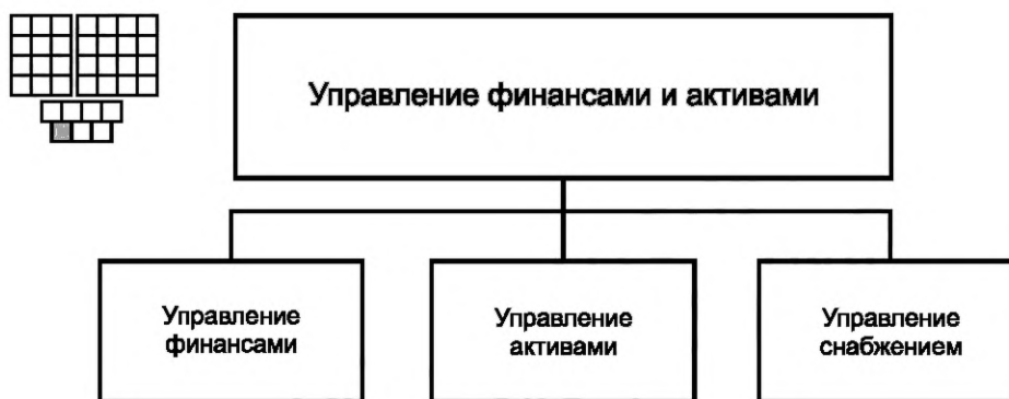
Рисунок 3 — Деконпозиция группы процессов «Управление финансами и активами» на элементы процессов уровня 2

6.1 Структура группы процессов «Управление финансами и активами» и соответствующие элементы процессов уровня 2 приведены на рисунке 3. На рисунке 3 представлена также пиктограмма, которая является общей для всех элементов процессов уровня 2.