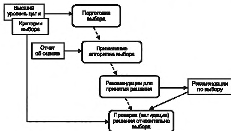
Рисунок 5 — Общее представление процесса выбора

В процессе выбора определяется его метод и осуществляется выбор с обоснованием в отчете об оценке (см. рисунок 5). Пригодность выбранного инструментального средства проверяется на уровне цели и руководства.