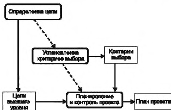
Рисунок 2 — Общее представление процесса подготовки

Определяется набор руководств по выбору инструментальных средств, разрабатывается план проекта. Общее представление процесса подготовки приведено на рисунке 2.