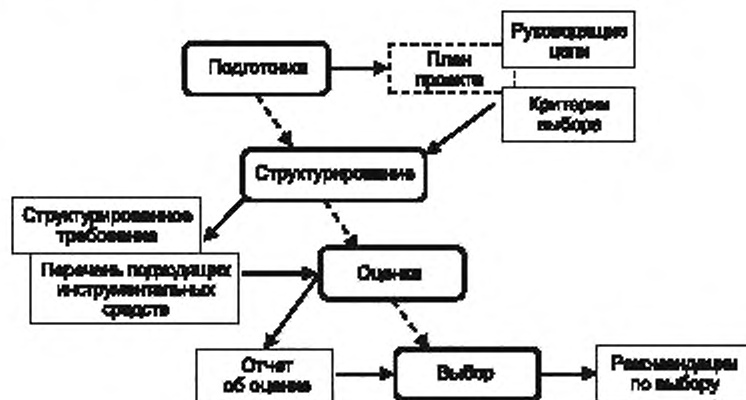
Рисунок 1 — Общее представление оценки и выбора инструментальных средств

На схемах процессов, приведенных на рисунках 1—5, прямоугольник с округленными углами обозначает процесс/действие, обычный прямоугольник — результат процесса/действия, а пунктирный прямоугольник — план, предполагаемый каждым процессом без каких-либо ссылок. Кроме того, сплошная стрелка обозначает поток данных, а пунктирная стрелка показывает порядок выполнения перехода между процессами/действиями.