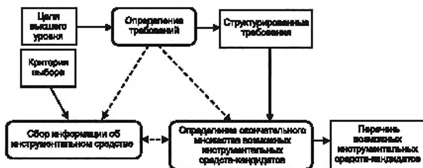
Рисунок 3 — Общее представление процесса структурирования

Поскольку на этапе подготовки создается структура выбора и оценки, в процессе структурирования требования к инструментальному средству собираются от организации пользователя, а детали требований структурируются (см. рисунок 3).