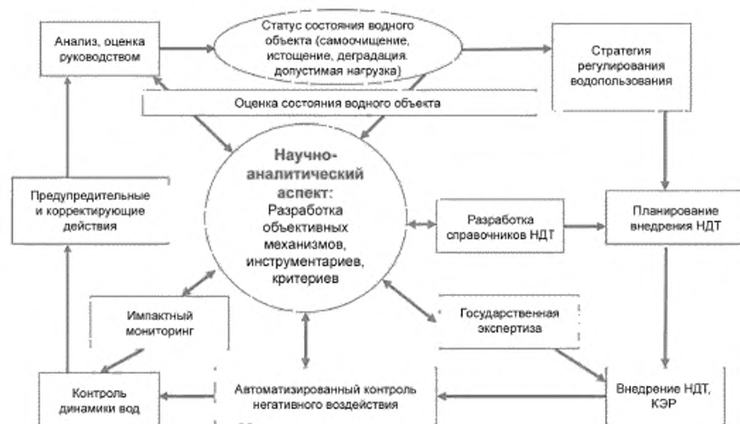
Рисунок Д.1 — Петля качества государственной функции регулирования водопользования

Петля качества регулятивной функции включает обязательную процедуру — научно-аналитическое сопровождение регулирования водопользования, акцентирование которого объясняется следующими основными причинами: