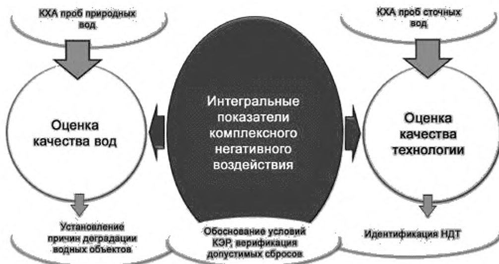
Рисунок Г.1 — Унификация экологического научно-аналитического сопровождения технологического регулирования водопользования