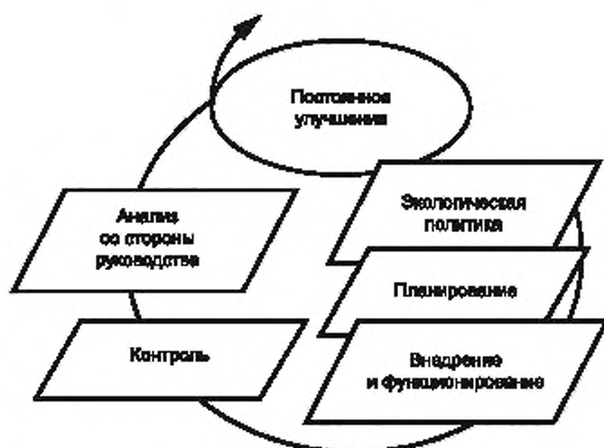
Рисунок А.1 — Модель системы экологического менеджмента — петля качества мероприятий по постоянному улучшению