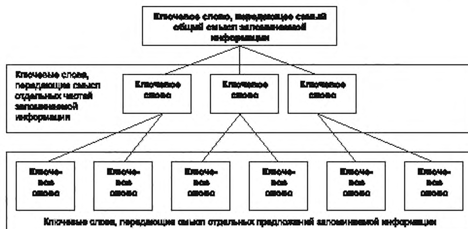
Рисунок 6 — Структурирование запоминания путем придания запоминаемой информации структуры типа «дерево»

Такие структуры распространены там, где необходимо кратко и компактно представить большой объем информации.