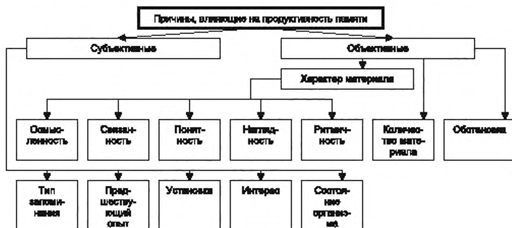
Рисунок 3 — Причины, влияющие на продуктивность памяти

Причины, влияющие на продуктивность памяти, представлены на рисунке 3.