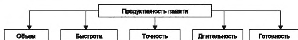
Рисунок 2 — Продуктивность памяти

4.27 Продуктивность памяти характеризуется объемом и быстротой запоминания информации, длительностью сохранения, готовностью и точностью воспроизведения (см. рисунок 2).