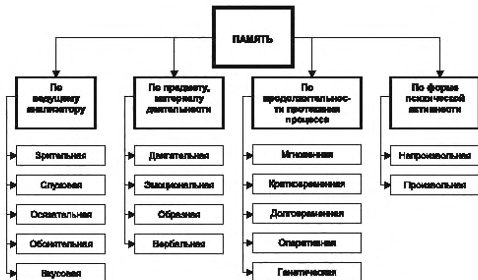
Рисунок 4 — Виды памяти в осуществлении запоминания информации

Она работает без предварительной сознательной установки на запоминание, но на последующее воспроизведение информации.