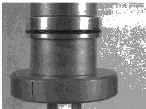
Рисунок 3 — Пример выпуклости надлежащей формы