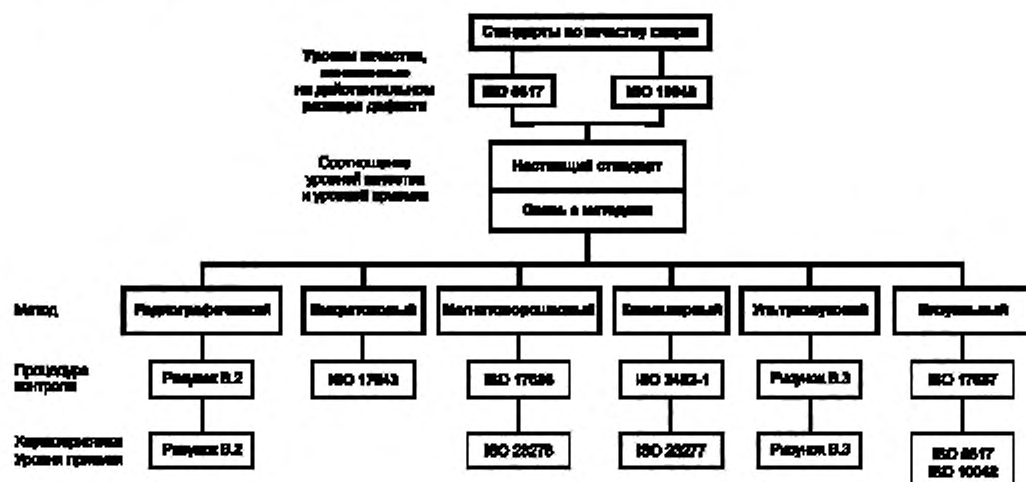
Рисунок В.1 — Диаграмма взаимосвязи стандартов

Диаграмма взаимосвязи стандартов представлена на рисунках В.1, В.2 и В.3.