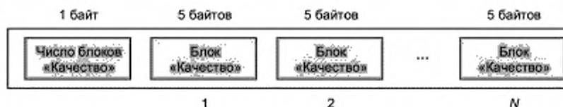
Рисунок 3 — Диаграмма записи данных о качестве (блоки «Качество»)

В таблице 2 представлена структура записи данных о качестве (блоки «Качество»). Значение каждого стандартного показателя качества (определенных в соответствующих частях серии стандартов ИСО/МЭК 29794 применительно к конкретным биометрическим характеристикам), если он рассчитан, должно быть закодировано в 5-байтовом блоке «Качество» в соответствии с ИСО/МЭК 19794-1:2011.