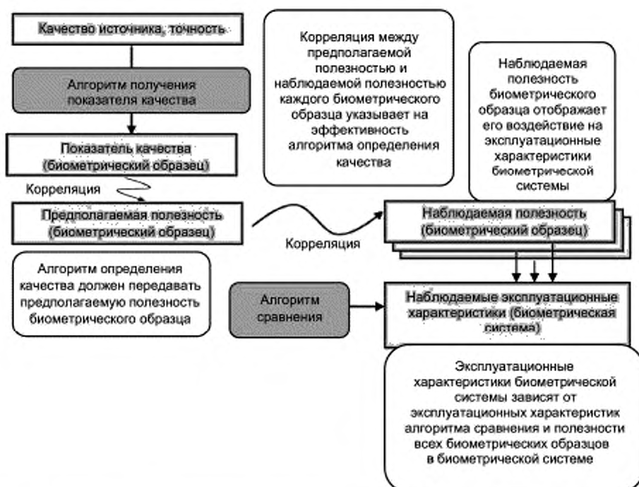
Рисунок 2 — Взаимосвязь между качеством и эксплуатационными характеристиками биометрической системы