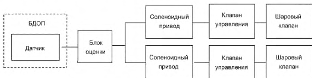
Рисунок А.2 — Архитектура функции, связанной с безопасностью

Все компоненты, за исключением шарового клапана (структура только с SIL 1, SFF менее 90 %), обеспечивают функцию, связанную с безопасностью до SIL 2 согласно таблице 2 IEC 61508-2:2010. Для обеспечения функции, связанной с безопасностью всей системы, выходной канал (соленоидный привод, клапан управления и шаровый клапан) должен иметь архитектуру, как показано на рисунке А.2.