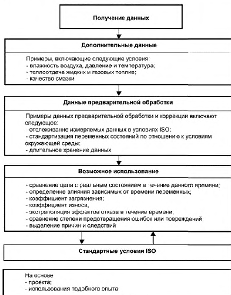
Рисунок 2 — Система мониторинга тренда (TMS)

Таким образом, можно определить отклонения от проектных значений, которые являются постоянными в течение долгого времени (например, для повышения эффективности), чтобы проверить значения, относящиеся к эксплуатационным расходам (например, удельный расход топлива), и следить за развитием нарушений или сбоев.