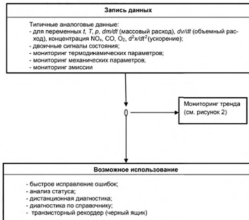
Рисунок 1 — Сбор данных

DA обычно требуют высокого уровня технических знаний и опыта, а также знаний о системе. Таким образом, их использование остается ограниченным опытным персоналом.