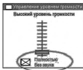
Рисунок 2 — Управление уровнем громкости

Звук должен быть установлен на минимальный уровень громкости (допустимо полное отключение звука, как показано на рисунке 2);