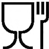
Рисунок Б.1 — Упаковка, предназначенная для контакта с пищевой продукцией

Б.2 Символ, обозначающий, что банки предназначены для контакта с пищевой продукцией, наносят непосредственно на банку или указывают в сопроводительной документации (см. рисунок Б.1).