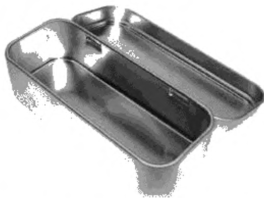
Рисунок А.5 — Сборная банка с крышкой на шарнире