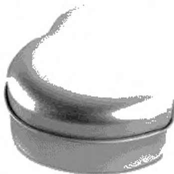
Рисунок А.3 — Фигурная банка