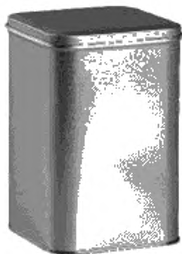
Рисунок А.1 — Прямоугольная банка