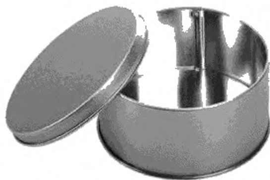
Рисунок А. 4 — Сборная банка со съёмной крышкой