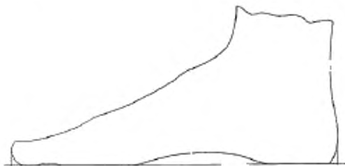
Рисунок 1 — Длина стопы

2.3 длина стопы (length of the foot): Максимальное горизонтальное расстояние от задней части пятки (максимальная точка изгиба пятки) до самого длинного пальца, измеряемое, когда человек стоит и его масса равномерно распределена на обе стопы (рисунок 1).