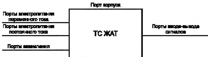
Рисунок 1 — Примеры портов ТС ЖАТ

- порт — граница между ТС ЖАТ и внешней электромагнитной средой (зажим, разъем, клемма, стык связи и т.д. (рисунок 1);