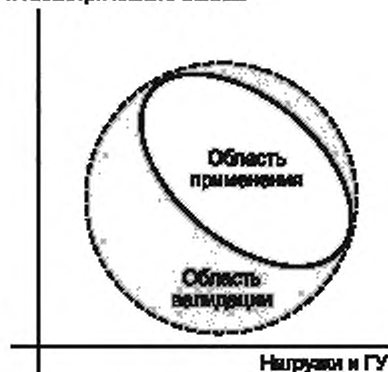
Рисунок 2 — Выбор области валидации

Описание физических процессов и геометрического объекта