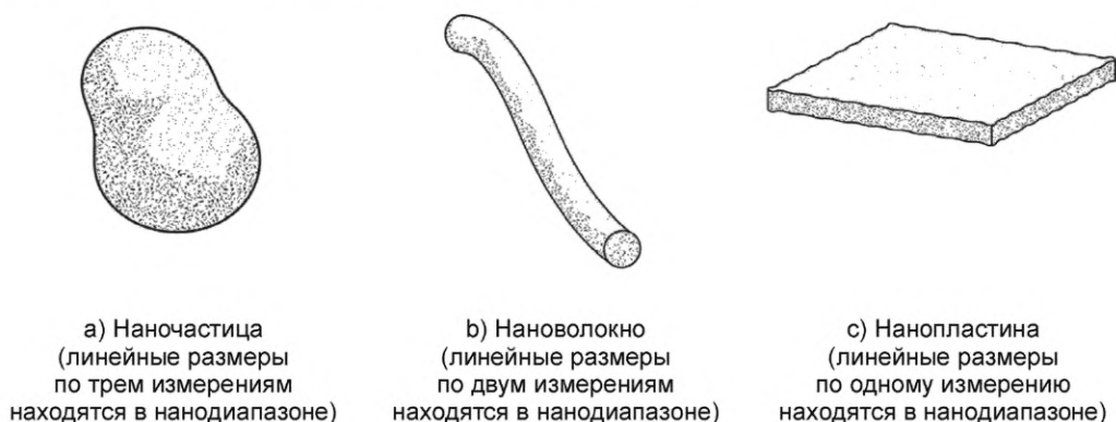
Рисунок 1 — Условные изображения форм трех основных нанобъектов, термины и определения которых установлены в настоящем стандарте

На рисунке 1 представлены условные изображения форм трех основных нанобъектов, термины и определения которых установлены в настоящем стандарте.