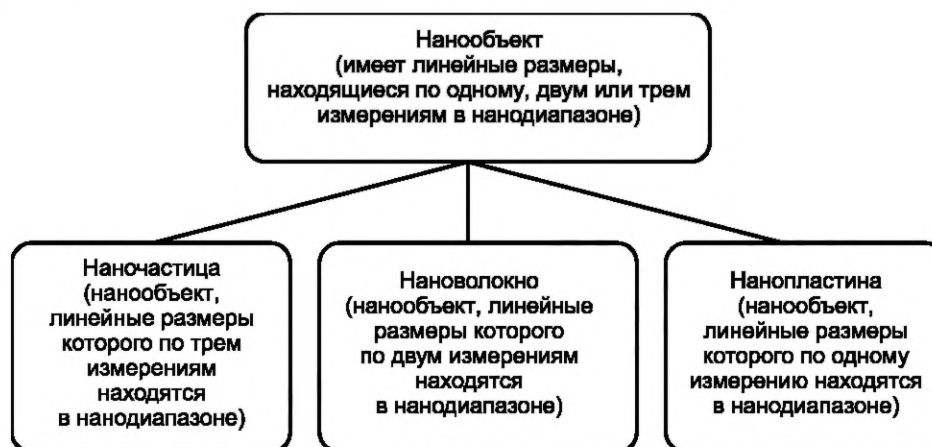
Рисунок 2 — Фрагмент иерархической взаимосвязи понятий, относящихся к нанобъектам

В настоящем стандарте термины и определения установлены с учетом иерархических взаимосвязей между понятиями. Фрагмент иерархической взаимосвязи понятий, относящихся к нанобъектам, представлен на рисунке 2.