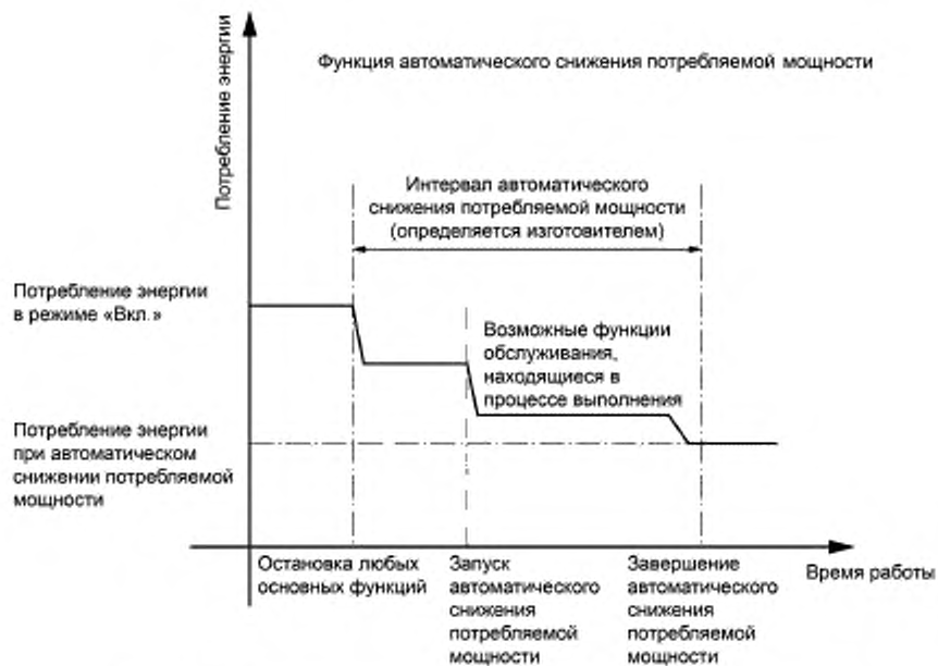
Рисунок 1 — Функция автоматического снижения потребляемой мощности