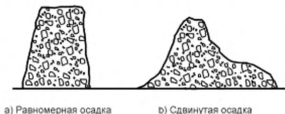
Рисунок 2 — Формы осадки

Регистрируют равномерную осадку h , как показано на рисунке 1, с точностью до 10 мм.