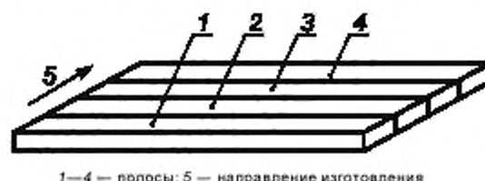
1—4 — полосы; 5 — направление изготовления

6.4 Полученный образец разрезают на четыре части перпендикулярно к направлению изготовления, как показано на рисунке 2, и выбирают полосу с наибольшим количеством сухих пятен.