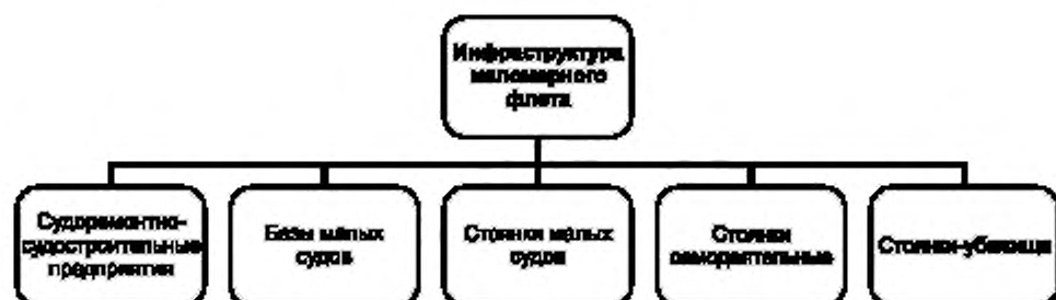
Рисунок А.3 — Функциональная схема инфраструктуры маловесного флота