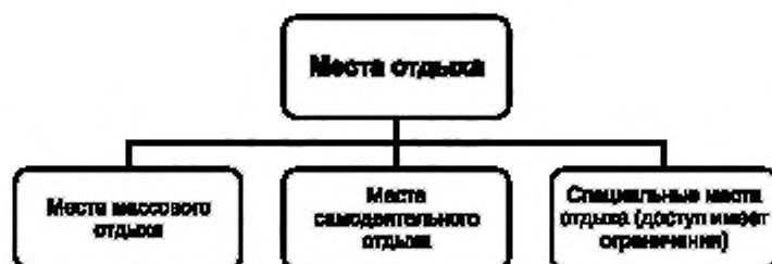
Рисунок А.5 — Виды мест отдыха