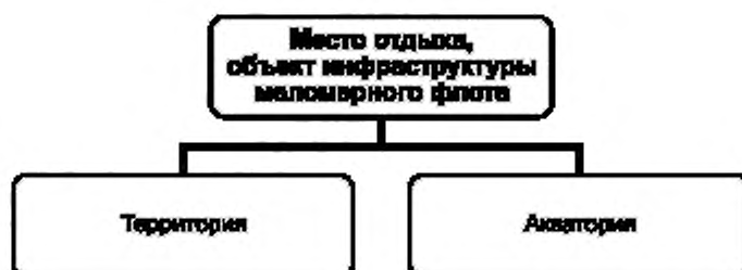
Рисунок А.2 — Структурная схема объекта