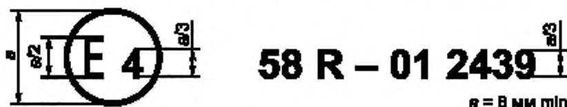
Образец А (См. 6.4, 15.4 и 24.4 настоящих Правил)

Приведенный выше знак официального утверждения, проставленный на транспортном средстве или ЗЗУ, указывает, что этот тип транспортного средства или тип ЗЗУ официально утвержден в Нидерландах (Е4) в отношении задней защиты в случае наезда на основании настоящих Правил под номером официального утверждения 01 2439. Первые две цифры номера официального утверждения означают, что официальное утверждение было представлено в соответствии с требованиями настоящих Правил с внесенными в них поправками серии 01.