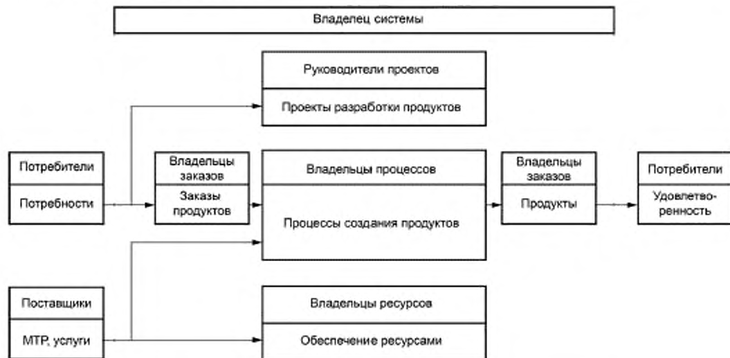
Рисунок 4 — Схема выполнения внешнего заказа в организации

5.8.1 Обобщенная схема выполнения внешнего заказа в организации и связанная с ним ответственность представлены на рисунке 4.