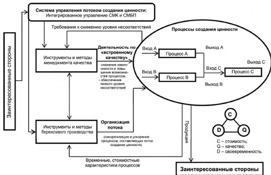
Рисунок 3 — Модель интеграции СМК и СМБП для управления потоком создания ценности 1)

На уровне системы менеджмента интеграция СМК и СМБП осуществляется через создание единой системы управления выходными характеристиками ПСЦ, обеспечивающей планирование, реализацию, контроль и улучшение ПСЦ (продукции и/или услуг) с необходимыми характеристиками качества, стоимости и времени потока продукции в соответствии с требованиями потребителей и других заинтересованных сторон организации (см. рисунок 3).