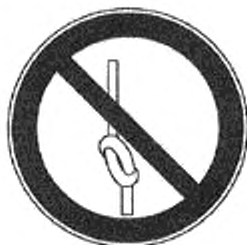
Рисунок 2 — Пример предупредительной таблички

6.3 Около подъемного устройства размещают предупредительную надпись «Не завязывать канат узлом» и табличку (см. рисунок 2).