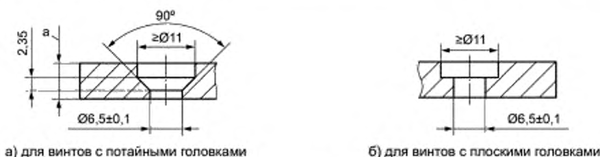
а — толщина в зависимости от глубины проникновения

4.2.4 Фрикционная пластина должна иметь конические или прямые отверстия в зависимости от вида формы головки винта (см. рисунок 2).