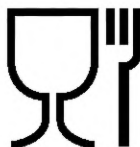
Рисунок 1 — Символ для упаковки, контактирующей с пищевой продукцией

6.2 Транспортная маркировка — по ГОСТ 14192.