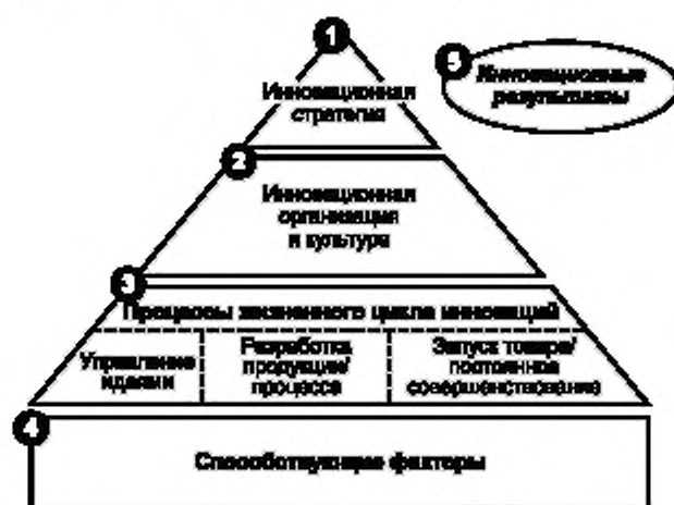
Рисунок 6 — Концептуальная основа оценки эффективности системы инновационного менеджмента

Помимо целостной области применения и логически обоснованной модели диагностическое исследование (проектирование) включает в себя проведение детальной количественной оценки. Диагностическое исследование (проектирование) включает в себя большое количество ориентированных на результат показателей и предполагает высокую достоверность собранных данных.