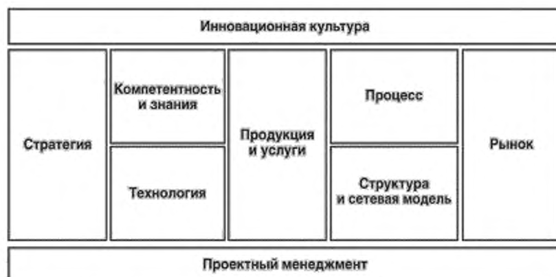
Рисунок 2 — Девять направлений проектирования

Заключение по общим инновационным возможностям и по направлениям проектирования может быть получено путем сравнения факторов успеха. Для инноваций можно спрогнозировать и спланировать факторы успеха в самой компании с тем, чтобы адекватно оценить их существенный вклад в успех предприятия.