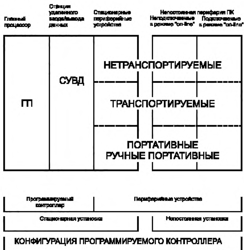
Рисунок А.1 — Конфигурация программируемого контроллера

На рисунке А.1 показана связь между определениями, относящимися к техническим средствам программируемых контроллеров.