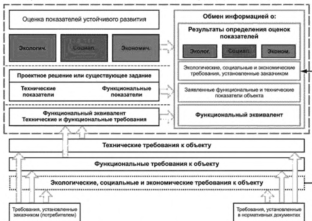
Рисунок 1 — Структура определения оценки показателей устойчивого развития строительного объекта

Все конкретные требования, относящиеся к экологическим, социальным или экономическим показателям, установленные потребителем, могут быть декларированы. На рисунке 1 показано, как следует декларировать результаты определения оценок, если функциональный эквивалент, технические и функциональные показатели отличаются от соответствующих требований потребителя.