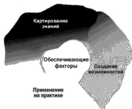
Рисунок 3 — Этапы реализации менеджмента знаний

Настоящий стандарт обеспечивает основу для понимания и реализации процесса управления знаниями. Это нелинейный циклический поток, в котором каждый этап (см. рисунок 3) можно проходить один или некоторое количество раз в соответствии с требованиями и потребностями организации. Средствами реализации являются инструменты, технологии и действия, используемые для реализации менеджмента знаний.