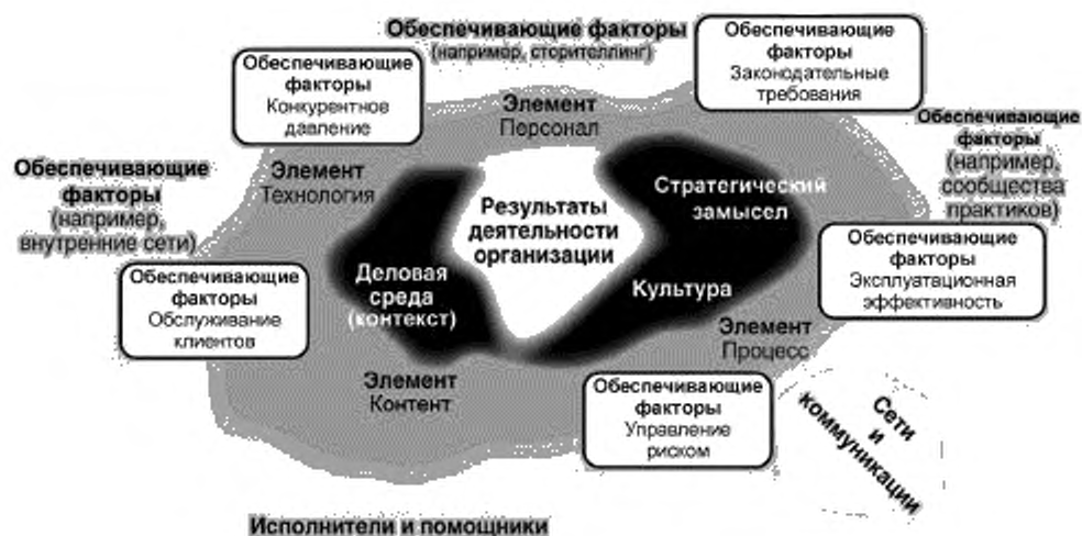
Рисунок 2 — Экосистема знаний