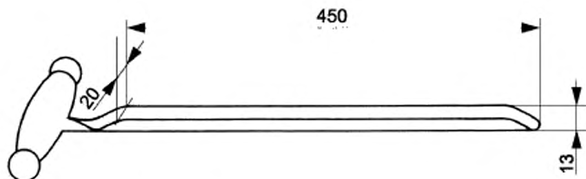
Рисунок 1 — Пробоотборник (открытый триер)

Пробоотборник (открытый триер), специально предназначенный для отбора проб из мешков (например, приведенный на рисунке 1).