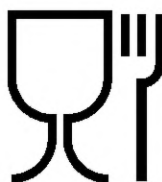
Рисунок Б.1— Упаковка, предназначенная для контакта с пищевой продукцией