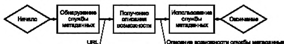
Рисунок 1 — Последовательность операций, выполняемых клиентом TV-Anytime для использования службы метаданных

Последовательность операций, выполняемых клиентом TV-Anytime для использования службы метаданных, показана на рисунке 1.