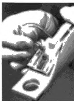
Рисунок 2 — Очистка прибора