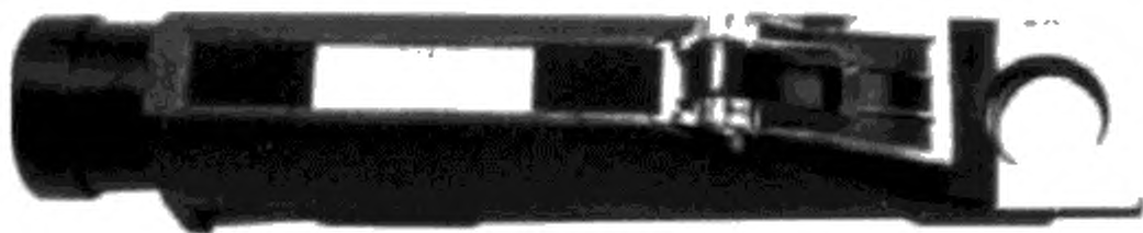
Рисунок 1 — Ручной рефрактометр предельного угла

6.2 Телескопический утопленный окуляр находится на одном конце, а полупрозрачная призма — на противоположном (см. рисунок 1).