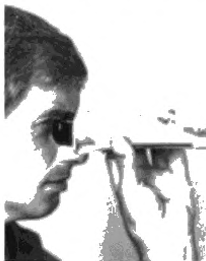
Рисунок 4 — Снятие показаний

Примечание 3 — Температурная шкала прибора обратна шкале стандартных термометров. Значения отрицательных температур расположены в верхней половине шкалы.