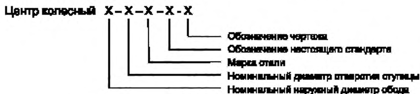
Рисунок 1 — Схема условного обозначения колесных центров

Схема условного обозначения колесных центров приведена на рисунке 1.