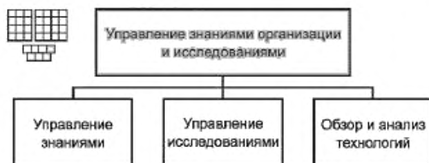
Рисунок 3 — Декомпозиция группы процессов «Управление знаниями организации и исследованиями» на элементы процессов уровня 2

6.2 Процессы группы 1.3.4 предназначены для управления знаниями, которыми располагает организация, для управления исследованиями новых технологий электросвязи и определения целесообразности их применения в организации, для планирования инвестиций и назначения приоритетов выполнения НИОКР (научно-исследовательских и опытно-конструкторских работ), обеспечивающих внедрение новых технологий.