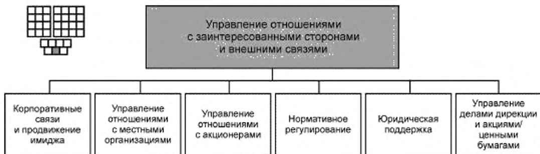
Рисунок 3 — Декомпозиция группы процессов «Управление отношениями с заинтересованными сторонами и внешними связями» на элементы процессов уровня 2

6.1 Структура группы процессов «Управление отношениями с заинтересованными сторонами и внешними связями» и соответствующие элементы процессов уровня 2 приведены на рисунке 3. На рисунке 3 представлена также пиктограмма, которая является общей для всех элементов процессов уровня 2.